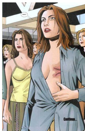
Figura 2 - YUH, #4, p. 22

[...] foi o movimento de estilo jovem, que nasceu em 1977, em Londres. A palavra significa podridão, sujeira, insanidade. O movimento levantou a bandeira da desilusão, sendo seu lema: No future . Surgiu durante a crise econômica inglesa da década de 70, com o desemprego e as novas formas de pobreza. [...] Este grupo adotou um traje anárquico, louco, desesperado e rasgado, moda dramática e sentimental. O vestuário Punk era um traje-cenário: botas de couro, correntes, [...] e tatuagem. O couro é o material nobre para o vestuário deste grupo. Como a pele é o couro de cada um, assim como se estampa um tecido ou camiseta, a própria pele que deve ser estampada em forma de tatuagem; é na pele que se sofre, onde estão os hematomas, por isso, a roupa-pele é rasgada: o hematoma da roupa. A agressividade do grupo é extensiva ao corpo de cada membro dele (FERRAZ, 2009 - negrito da autora).