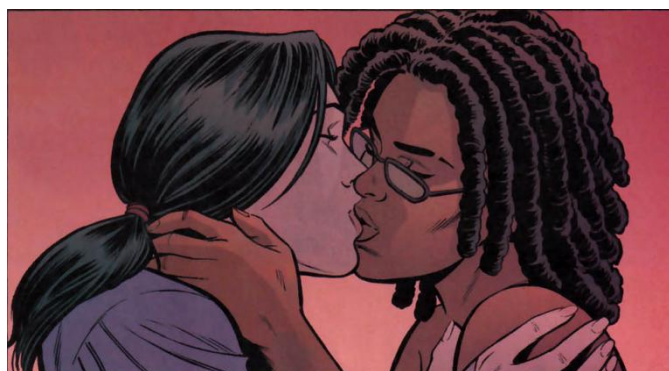
Figura 11 - Allison e 355 (detalhe)

Intuitivamente, Mann procura pelo amor através dos relacionamentos. A cisão com Mercedes a feriu pela indiferença que sofrida depois de anos de construção de confiança. Em relação à 355, no episódio YUH #23, vários anos antes do affair , quando o grupo está tentando ir Boston, Allison chama 355 para conversar e diz que mentiu/escondeu sobre a experiência de clonagem para não ser mal interpretada pela agente, porque gostaria que a soldado gostasse dela (p.11). Somente em YUH #33 haverá uma ligação sexual entre 355 e a Dra. Mann, um ano depois. Devido ao caráter de urgência sexual e (talvez) pela não intenção de relacionamento afetivo, a agente prefere não conversar mais sobre o assunto. Esse mal-estar corrobora a desconfiança da Dra. Mann em relação aos relacionamentos. Então, quando a Dra. Allison conhece a soldado Rose, não se permite imediatamente a viver a potencialidade do que sente.