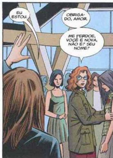
Figura 7 - YUH, #4, p. 21 (detalhe)

A página seguinte é uma splash page , quadro de página inteira cujo propósito é ilustrar um momento dramático extraordinário na trama (JANSON, 2005, p.75). É exatamente quando descobrimos que a voluntária chama-se Herói e é a irmã do último homem. A perspectiva usada nessa página é a partir de um ponto de fuga sobre a cabeça de Hero, o que empurra as demais mulheres para trás, destacando aquela personagem dentre muitas, com rosto, mas sem nome. Podemos depreender das expressões que estão todas num mesmo nível de surpresa e ansiedade, os olhos provavelmente na direção de Victoria. Segundo o desenhista Klaus Janson: