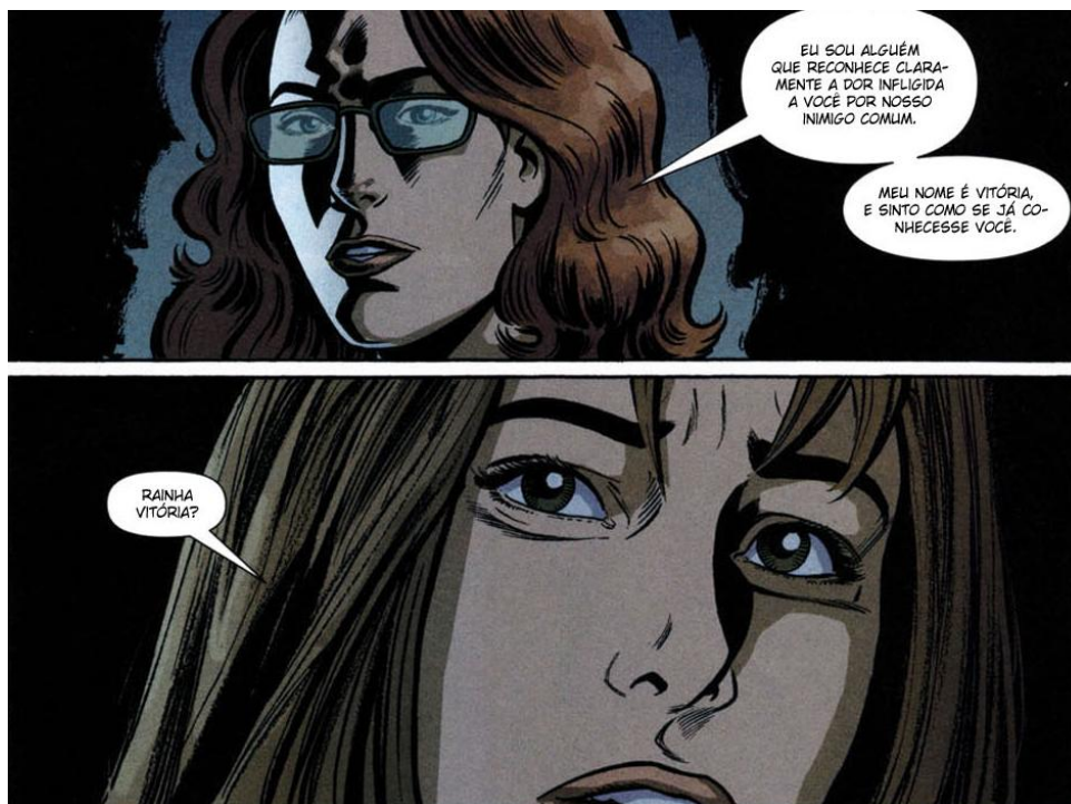
Figura 3 - YUH, #26, p.13 – detalhe

Em segundo lugar, Vitória tem o sentido de superação, o que também se relaciona bem com a personagem FDA.