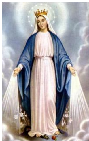
Figura 5 - Nossa Senhora das Graças

Outro exemplo de carisma da líder Victoria é a recompensa (num mundo apocalíptico em que bens triviais são mais valorizados) em forma de chocolate, que Hero Brown recebe como bônus pelo comportamento agressivo e reforço positivo pela suposta confiança. Victoria nutre, como uma mãe, e privilegia Hero, pois só ela recebe chocolate: "[...] Eu iria gostar se você não contasse as suas irmãs sobre isso " [Fig. 5].