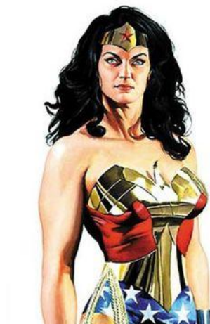
Figura 1 - Mulher Maravilha (por Alex Ross)

Essa visão negativa das Amazonas foi mantida na criação da personagem Mulher Maravilha [Fig. 1] (DC Comics), nos anos 40. Se por um lado ela reconfigura o pensamento de que a mulher pode e deve ocupar todos os espaços sociais - inclusive de fala - por outro reafirma o estereótipo de amazona (masculinizada). Tal referência, em nosso primeiro olhar, fará crer que As Filhas das Amazonas se apropriam da identidade masculina, porém, essa é apenas a camada de leitura mais exterior.