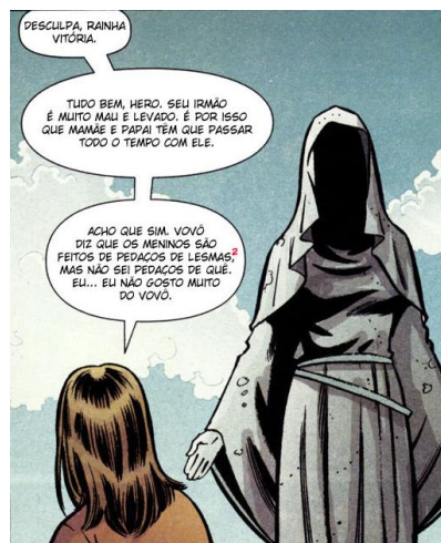
Figura 4 - YUH, #26, p. 4 - detalhe

Em segundo lugar, Vitória tem o sentido de superação, o que também se relaciona bem com a personagem FDA.