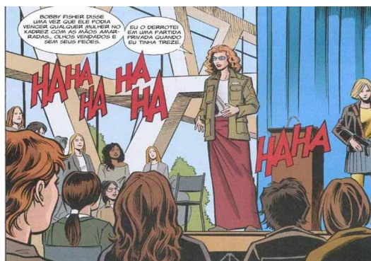
Figura 2 - Victoria (YUH #4, p. 20 - detalhe)